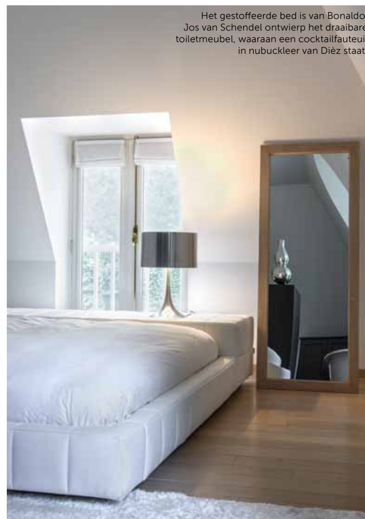
Het gestoffeerde bed is van Bonaldo. Jos van Schendel ontwierp het draaibare toiletmeubel, waaraan een cocktailfauteuil in nubuckleer van Dièz staat.

De bovenverdieping moest stevig worden aangepakt. Jos: "Als je opdrachtgever durft los te laten, kom je als ontwerper tot een beter resultaat." In de ouderslaapkamer is dat duidelijk zichtbaar. Een massieve, houten kast werd gesloopt en in de plaats kwam een multifunctioneel meubel midden in de kamer. Aan de bedzijde hangt de televisie, aan