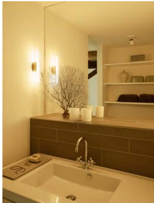
Badkamer Sobere eenvoud en gedempte tonen zijn bepalend in de badkamer.