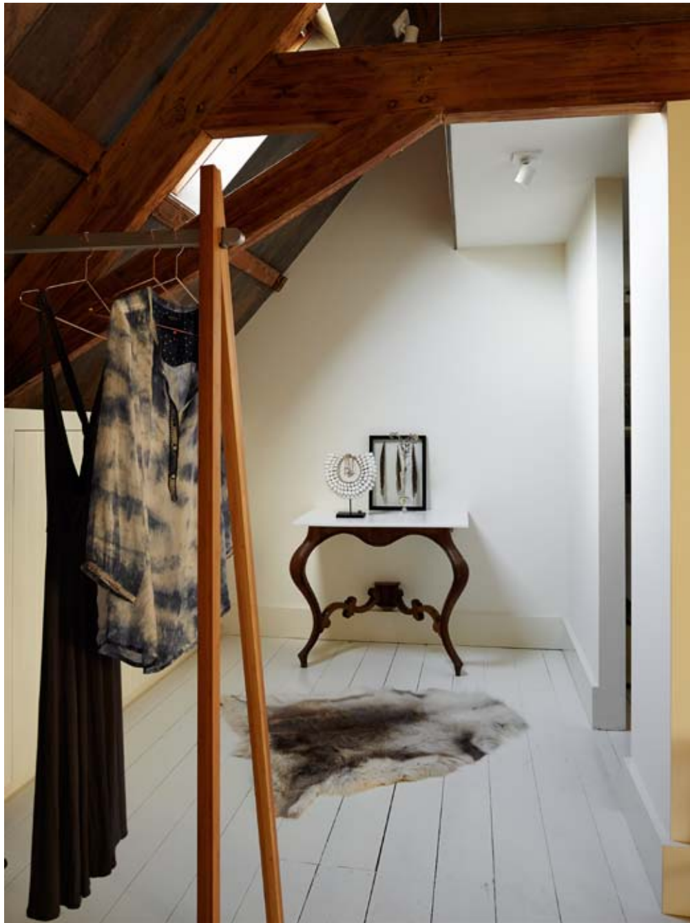
Antiek-effect Een doorgezaagde oude tafel met een stuk marmereen snijplank wekt de indruk antiek te zijn.

Het paar ging met beleid te werk. “Je koopt zo’n authentiek pand natuurlijk ook vanwege het prachtige silhouet en de oude balkenstructuur. Laat je die intact, dan ben je al een eind op weg. Hoe je het daarna precies invult, is minder relevant. Het monumentale hout zorgt al voor zo veel karakter.” Vintage heeft als voormalig horeca-ondernemer – onder andere het bekende Haagse restaurant Pastis – en grafisch ontwerper wel een oog voor detail. “Als de ruimtelijke verhoudingen en de hoofdstructuur van plafond, vloer en wanden kloppen, kun je daarna vrij te werk gaan.”