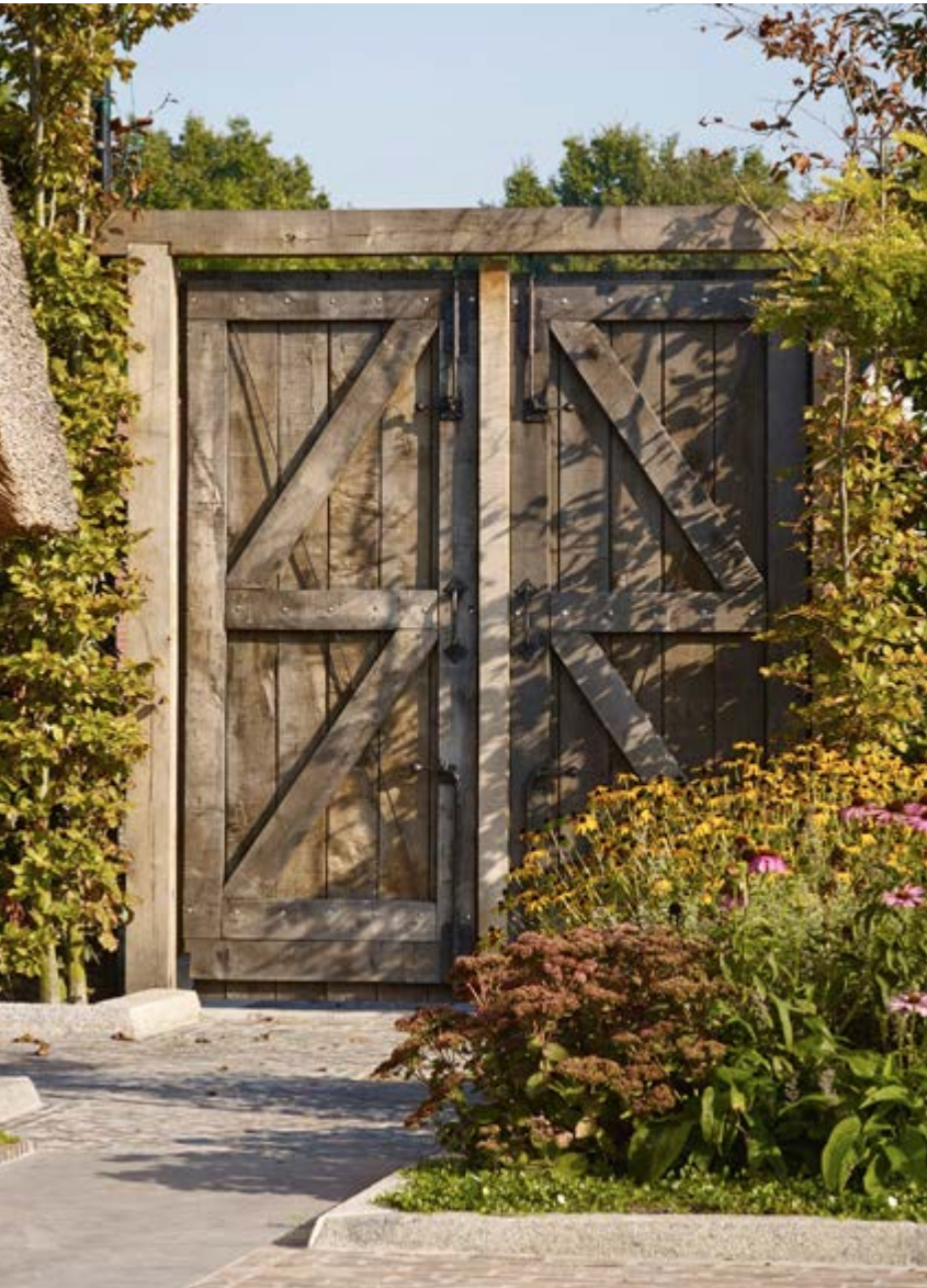
Toegangsdeuren naar het speelveldje van de kinderen.

wat anders ogen. We hebben er hier daarom voor gekozen het robuuster te laten. Riet en balken zijn bewust niet weggewerkt achter gestuukte wanden, terwijl dat in het woonhuis wel het geval is.”