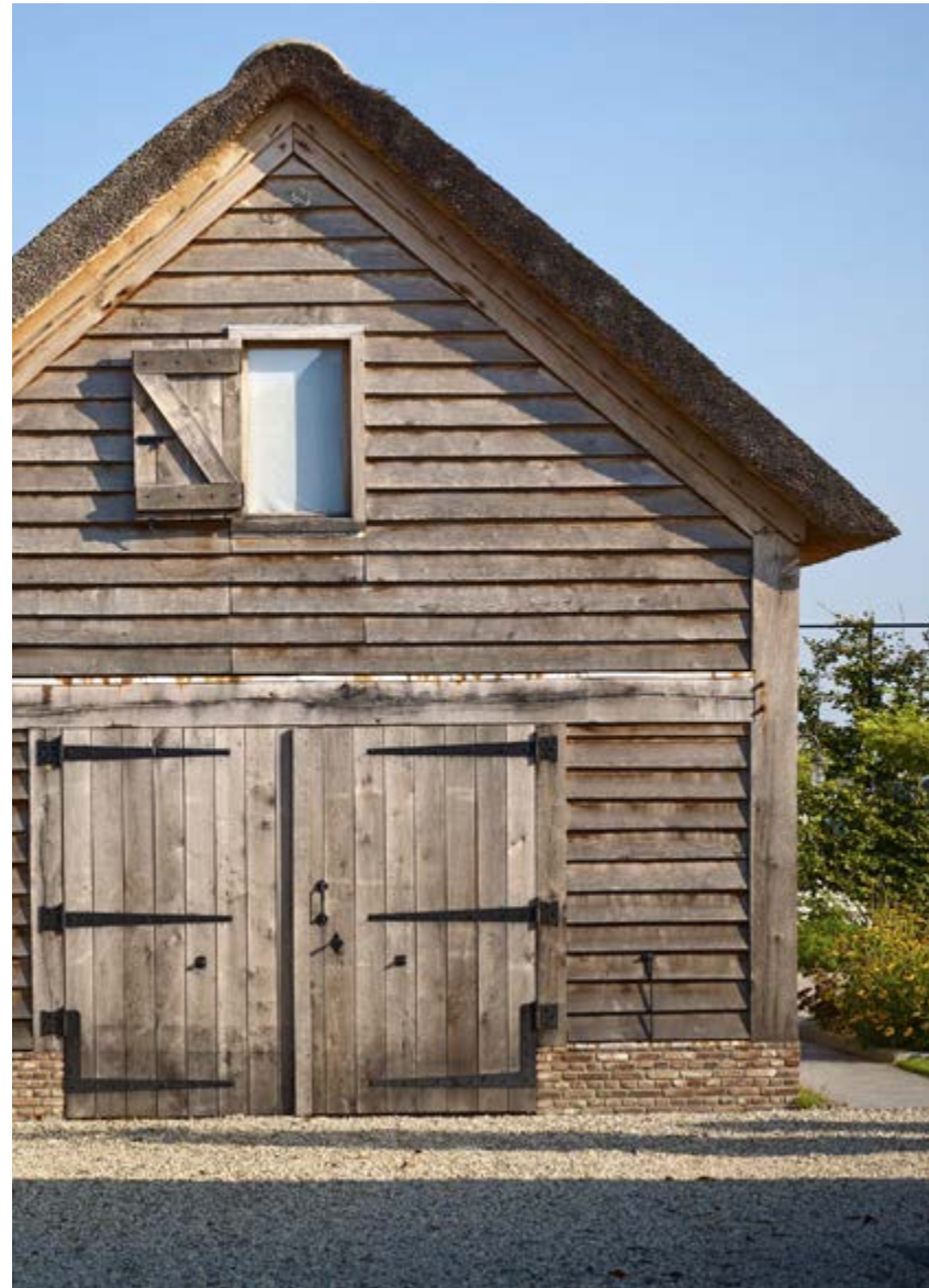
De voorgevel van het bijgebouw werd geheel in eiken opgetrokken.